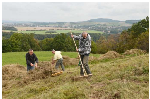
Arbeitseinsatz der Zittauer Gruppe auf dem Scheiber-Spitzberg bei Mittelherwigsdorf