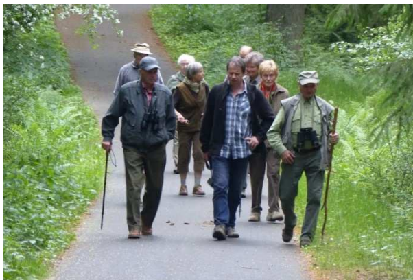
Exkursion der Nieskyer Gruppe zum Reitergrund bei Steinbach/Rothenburg