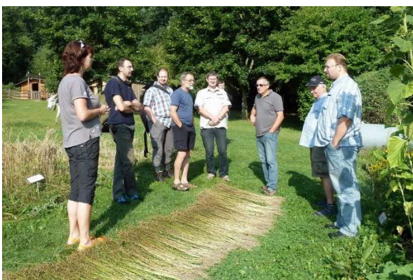
Jahresschulung der Löbau-Zittauer Gruppe im Eurohof Hainewalde