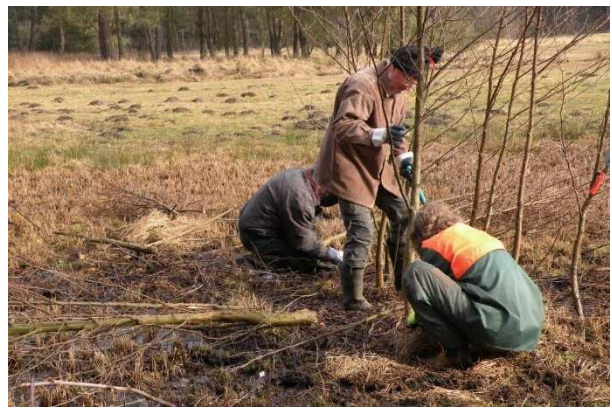
Arbeitseinsatz der Weißwasseraner Gruppe gemeinsam mit dem NABU: Entbuschung der Feuchtwiese im Muskauer Faltenbogen (Malenza)